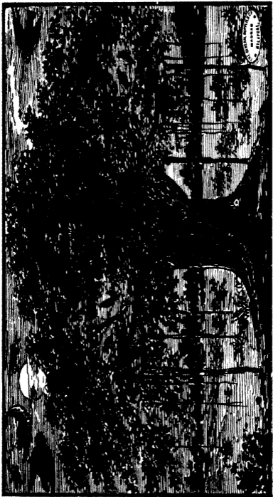
காகங்களைக் கோட்டான்கள் தூக்கல்—77-ம் பக்கம் பார்க்க.