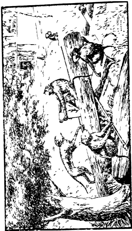
木丁座子 一〇五 〇五五 〇五五 〇五五 〇五五